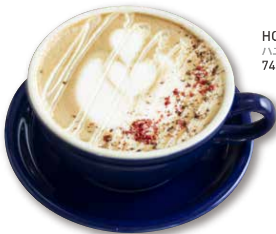
HONEY PEPPER LATTE ハニーペッパーラテ [HOT] 740