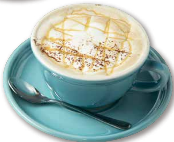
WHITE MOCHA ホワイトモカ [HOT] 740